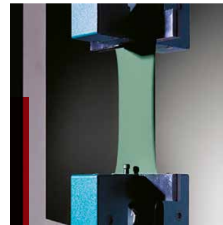
TEST PREKIDNE SILE