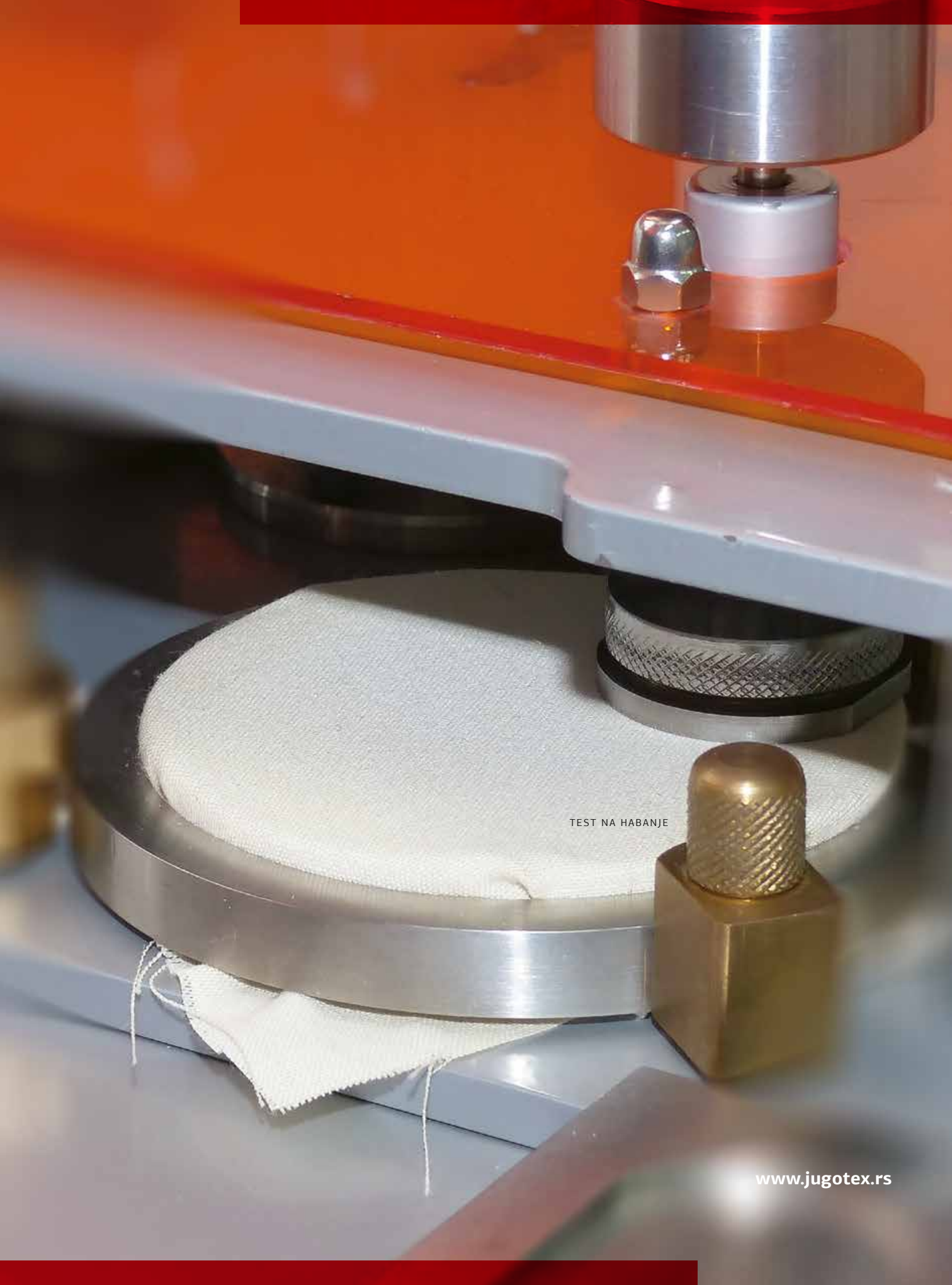
TEST NA HABANJE