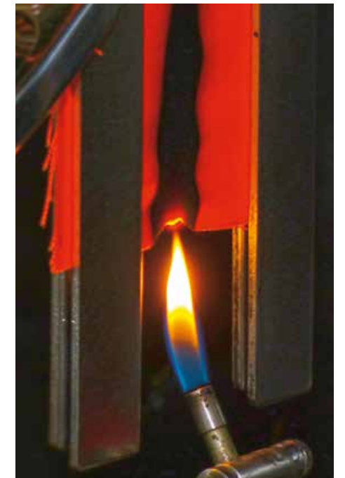
TEST NA GORENJE

Kompanija posluje po strogim svetskim standardima što se potvrđuje dobijenim sertifikatima za ISO 9001, ISO 14001 i OHSAS.