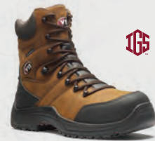
V1255.01 Rocky IGS Brown Waterproof Zip Side IGS High Leg Boot