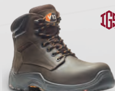
VR601.01 Bison IGS Brown Metal-Free IGS Derby Boot