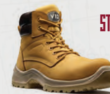
V6420.01 Bobcat STS Honey STS Derby Boot