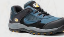
VS400 Pitstop Cobalt Trainer