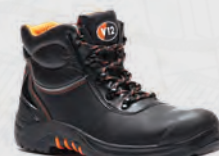
VR657 Endura II Black Scuff Cap Boot