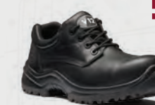
V6411.01 Oxen STS Black Metal-Free STS Shoe