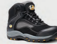
VS360 Track Black/Graphite Hiker