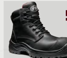
V1801 Ibex STS Black Waterproof Metal-Free STS Derby Boot