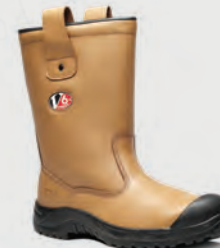
V6816 Polar Tan Fur Lined Rigger Boot