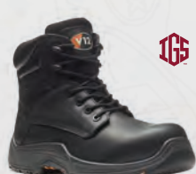
VR600.01 Bison IGS VR600.01XL Bison IGS Black Metal-Free IGS Derby Boot