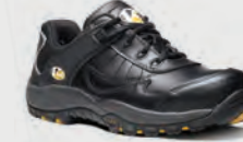
VS600 Slam Black Trainer