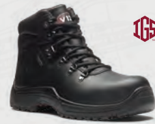
V1215.01 Thunder IGS Black Waterproof IGS Hiker

Више информација о производу доступно је на нашој веб страници V12footwear.com