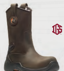
V1607 Tigris IGS Brown Unlined Rigger Boot