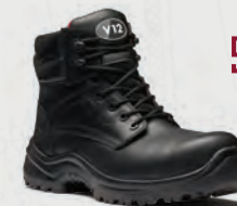
V6400.01 Otter STS Black Metal-Free STS Derby Boot