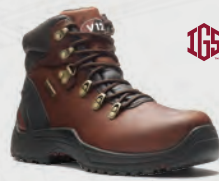
V1219.01 Storm IGS Brown Waterproof IGS Hiker