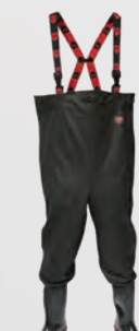
VW164 Avon Black Midsole PVC Thigh Wader