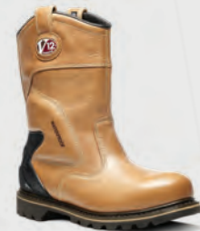
V1250 Tomahawk Tan Waterproof Rigger Boot