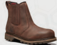
V1261 Rancher Brown Non-Safety Dealer Boot