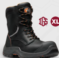
VR620.01 Avenger IGS VR620.01XL Avenger IGS Black Zip Side IGS High Leg Boot