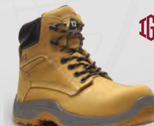
VR602.01 Puma IGS Metal-Free Honey IGS Nubuck Boot