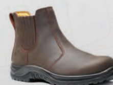
VR610 Stallion Brown Dealer Boot