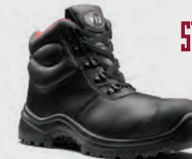
V6863.01 Rhino STS Black Scuff Cap STS Chukka Boot