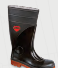
VW251XL Sitemaster Black / Red PVC Steel Toe & Midsole Wellington