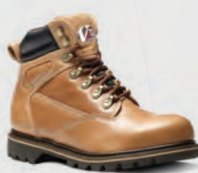
V1244 Mohawk Tan Chukka Boot