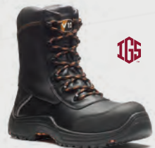
E1300.01 Defiant IGS Black Zip Side High Leg IGS Boot