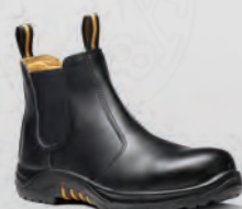
VR609 Colt Black Dealer Boot