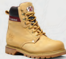
V1237 Boulder Honey Derby Boot