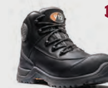
V1720 Intrepid IGS Women's Black IGS Hiker