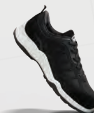
VT151 Active Safety Trainer Black / White