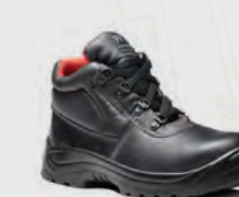
V6471 Elk Black Chukka Boot