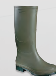
VW057 Vital Value Green / Black PVC Non-Safety Wellington