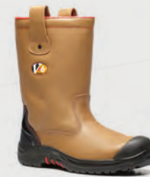
VR690 Grizzly Tan Fleece Lined Rigger Boot