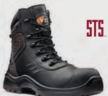
V1750 Defender STS Black STS Waterproof Scuff Cap Boot