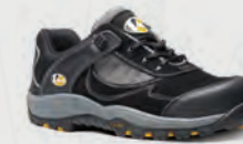
VS300 Fastlane II Black/Graphite Trainer