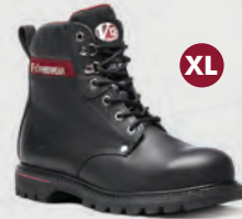
V1235 Boulder V1235XL Boulder Black Derby Boot