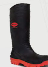
VW256 Titan Black / Red PVC Steel Toe & Midsole Wellington