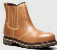
V1241 Stampede Tan Dealer Boot