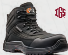
V1501.01 Caiman IGS V1501.01XL Caiman IGS Graphite Waterproof IGS Hiker