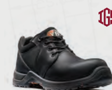
V1710 Challenger IGS Women's Black IGS Shoe