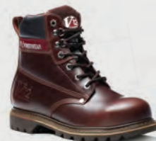
V1236 Boulder Mahogany Derby Boot