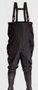
VW165 Thames Black Midsole PVC Chest Wader