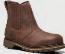
V1231 Rawhide Brown Dealer Boot