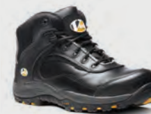
VS640 Smash Black Hiker