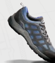
VT153 Active Safety Trainer Blue / Grey